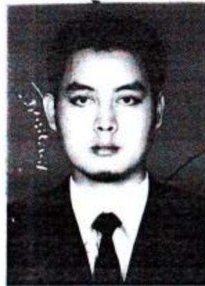
Dr. (HC). Ir. BURHANUDDIN ABDULLAH, MA.